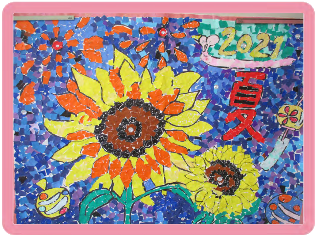
「夜空のひまわり～2021夏」 回復期リハビリテーション病棟 入院患者さんの 作品