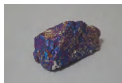
キャルコパイライト