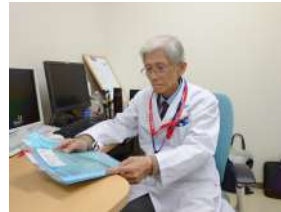
栄光病院・健診センターにて