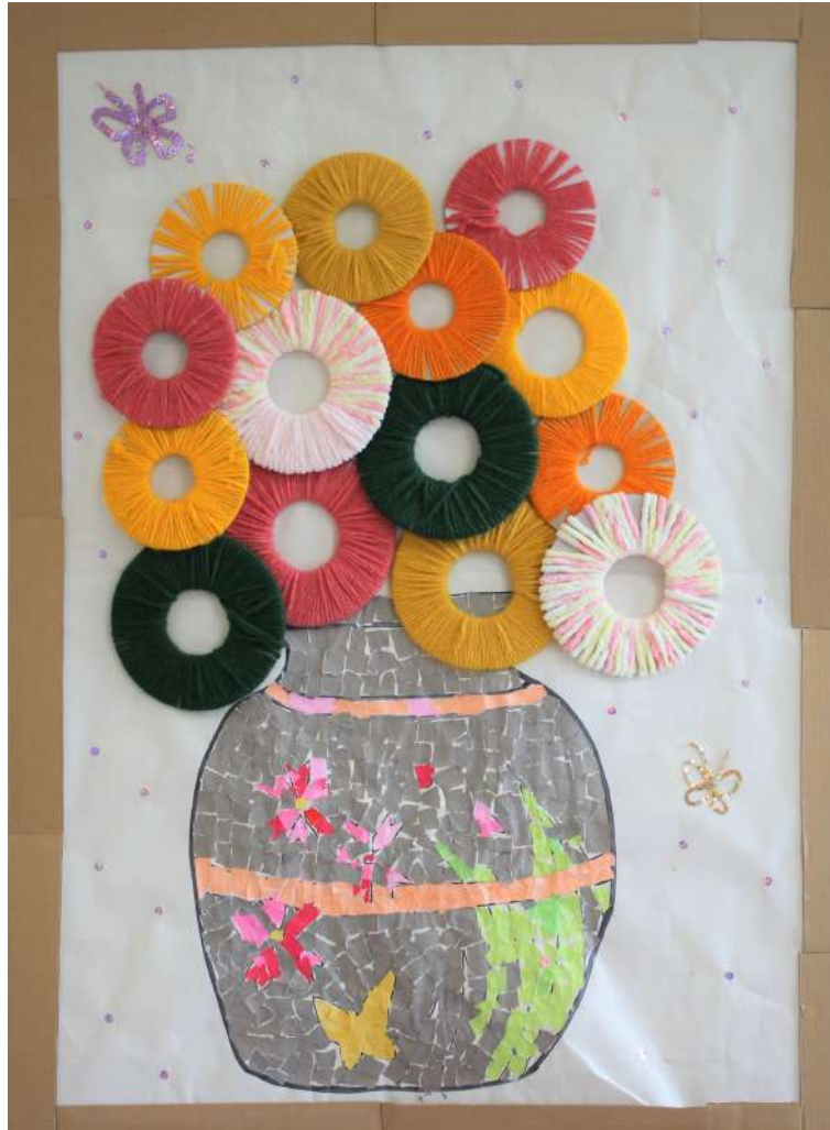
「輪の花」 回復期リハビリテーション病棟 の作品