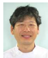
リハビリテーション科 医師