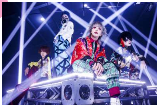
コドモドラゴンとは・・・2010年04月に結成し、2010年11月より本始動した。固定観念に捕らわれない音楽スタイルを得意とする日本のヴィジュアル系ロックバンド。

コロナ禍で自宅に閉じ籠るようになり、2020年ばかりでなく、私にとっての新曲を2,000曲くらい聴く1年でした。 そんな中で出逢ったヴィジュアル系バンドのコードモドラゴン、衝撃でした。12年活動しているバンドなので、たくさんある過去作品、CD・DVDを買って集めて軌跡を追いかけて、人生初のヘッドバンギングというものをすることができました。 40肩で腕は上がらないし、足首の関節が固くなって曲がらないし、まして飛び跳ねる体力がないと感じていましたが、振り付けを覚えて休日に2時間のダンスパーティーを繰り返すうちに、この2年で気力体力急上昇。