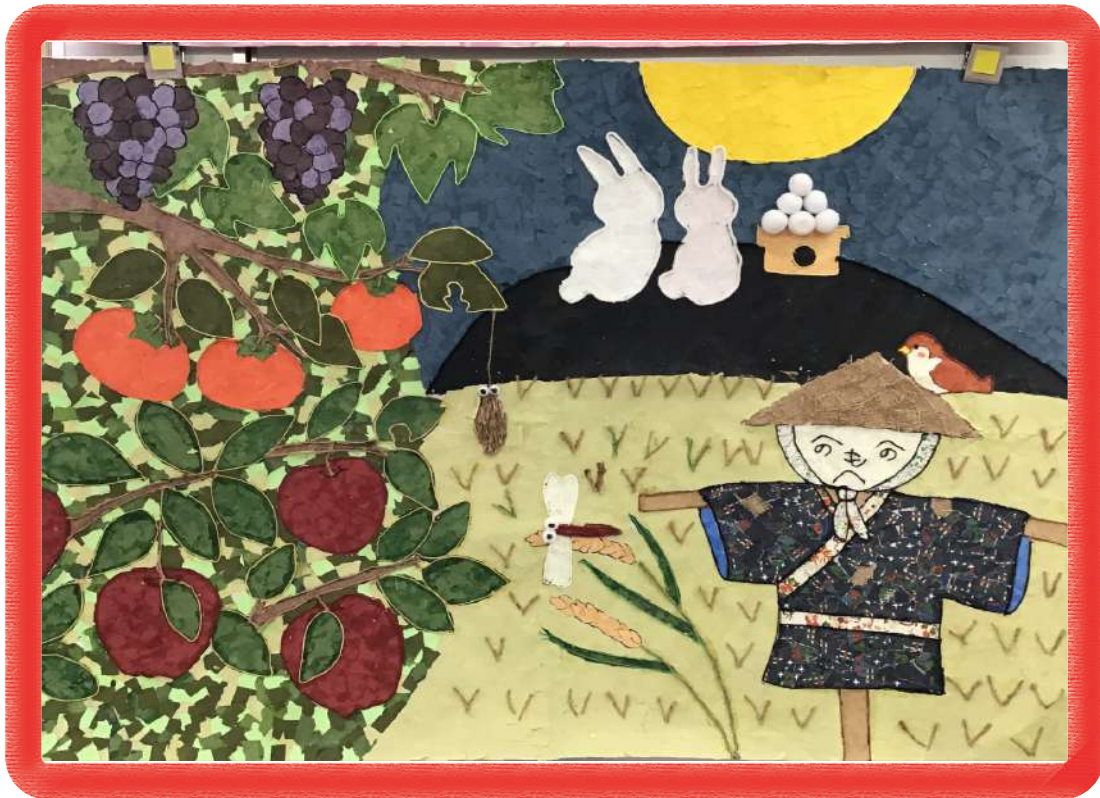
「実りの秋」 通所リハビリテーション利用者さんの作品