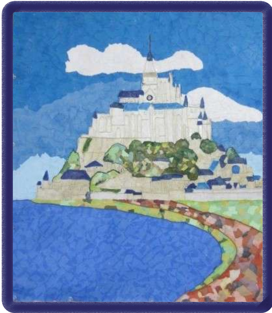
「モン・サン=ミッシェル」 通所リハビリテーション 利用者さんの作品