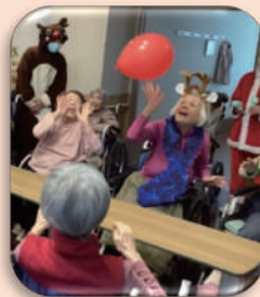
プレゼントはやっぱり嬉しいですね