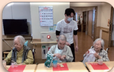
くじ引きで大当たり~!