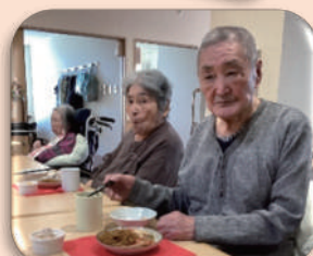
焼きそばやピザも好評でした!