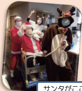
サンタがここにやってきました!